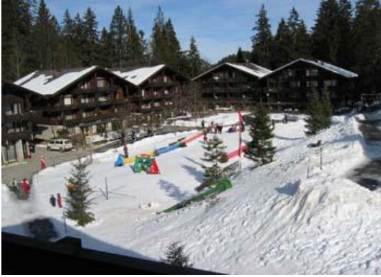
Blick von der Wohnung