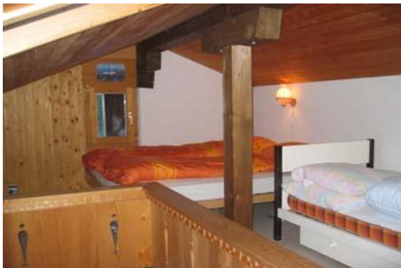
Schlafen: 2 Einzelbett 1 Doppelbett