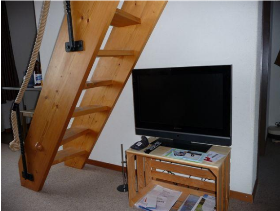
Aufstieg zur Galerie