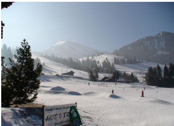
Beim Haus Barbara mit Blick auf das Skigebiet