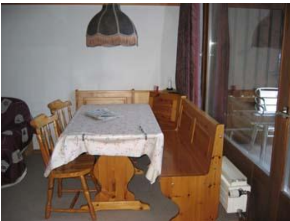
Essen / Wohnen