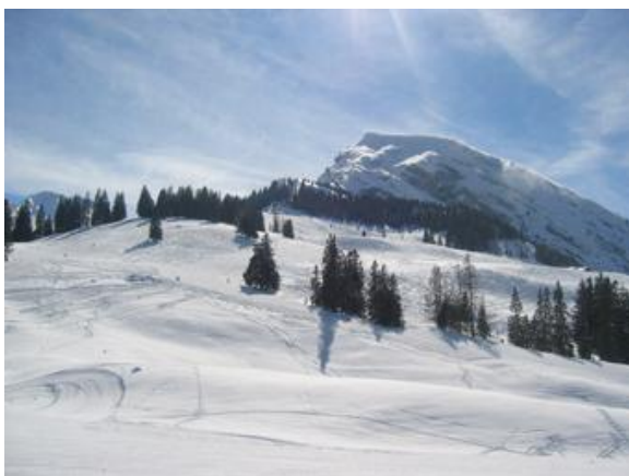
Im Skigebiet Wiriehorn