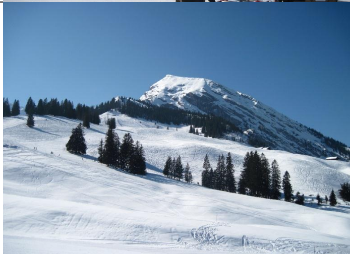
Im Skigebiet Im Hintergrund das Wiriehorn