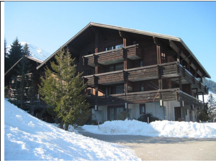
Haus Barbara Dachwohnung