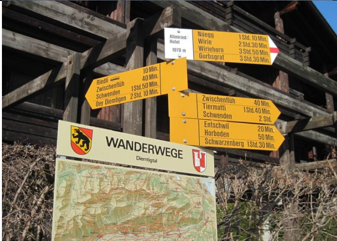
Viele Wandermöglichkeiten vorhanden