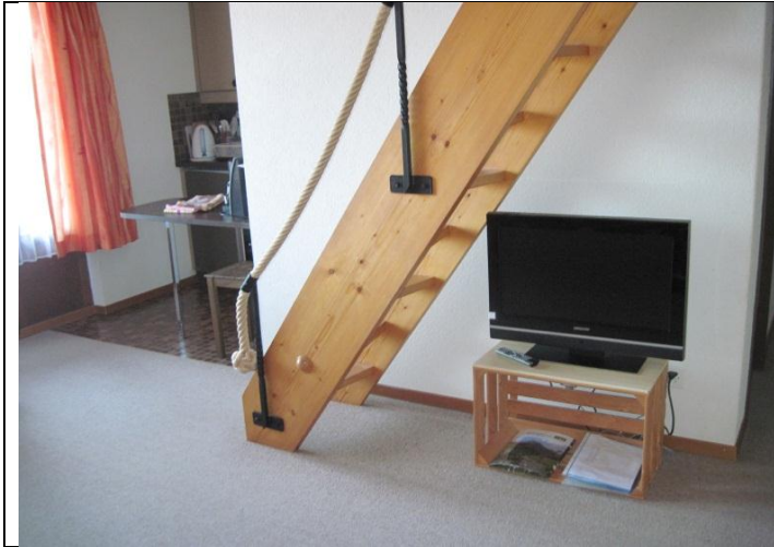
Treppe zur Galerie