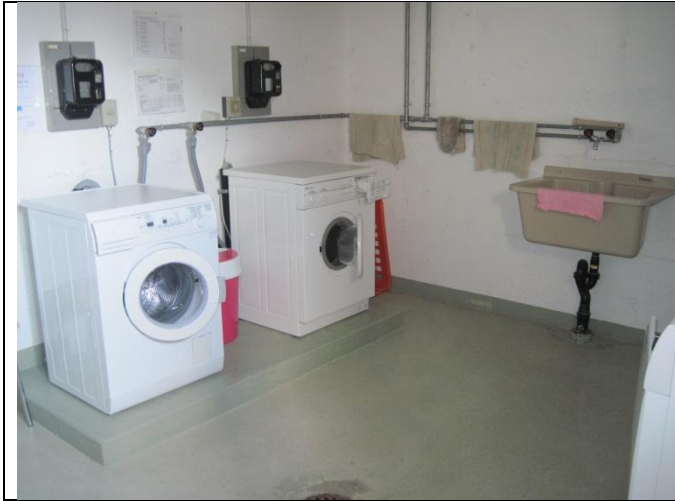
Waschraum für das ganze Haus