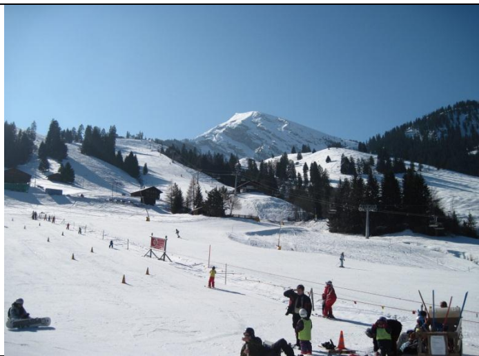
Kinderskilift bei der Wohnung Im Hintergrund die Sesselbahn und das Wiriehorn