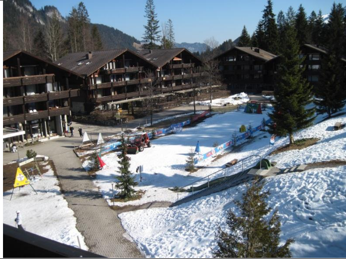
Sicht vom Balkon